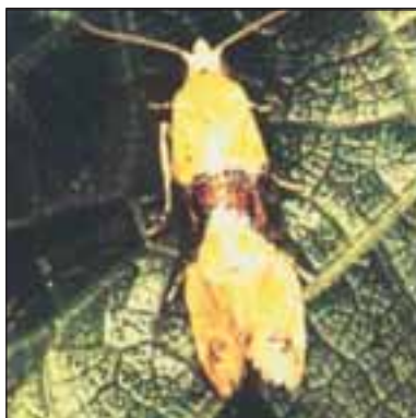
Еднопоясен гроздов молец - Euroecilia ambiguella