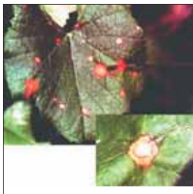
Черно гниене - Phoma uvicola