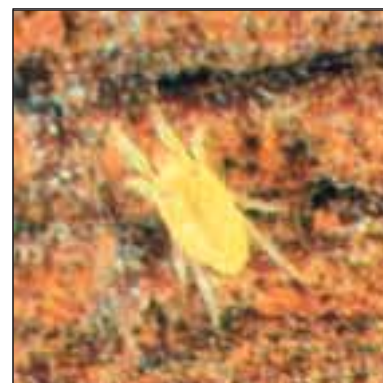
Жълт лозов акар - Schizotetranychus viticola