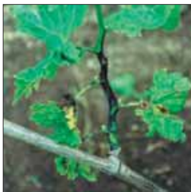
Ексориоза по лозата - Phomopsis viticola