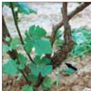
Бактериален рак по лозата - Agrobacterium vitis