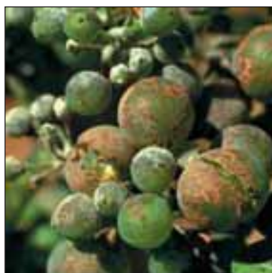
Брашнеста мана по лозата - Oidium tuckeri