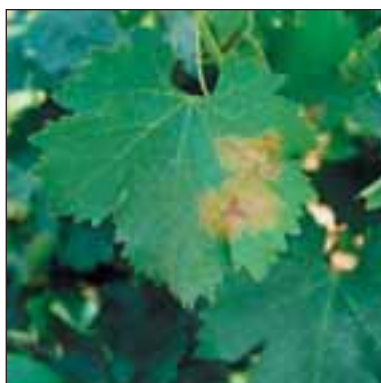
Мана по лозата - Plasmopara viticola