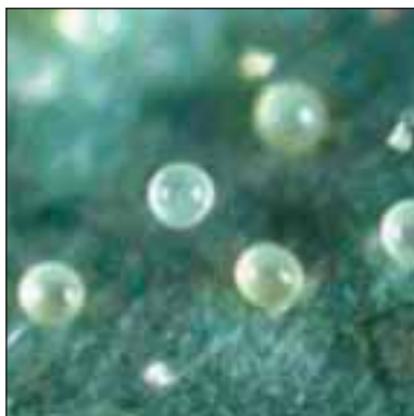
Жълт лозов акар - Schizotetranychus viticola