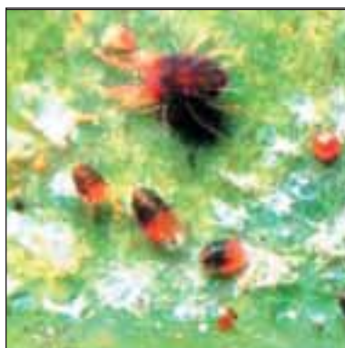
Червен овощен акар - Panonychus ulmi