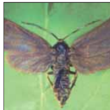
Лозова пъстриянка - Уно (Procris) ampelophaga