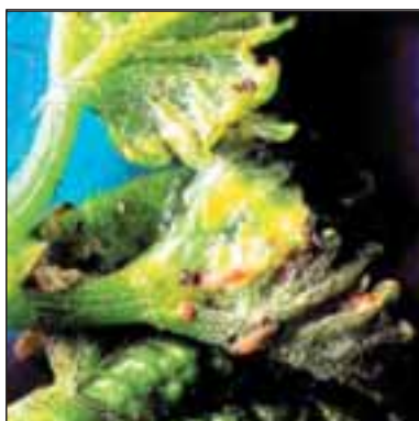
Лозова листозавивачка - Sparganothis pilleriana