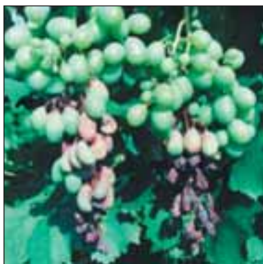
Бяло гниене - Coniella diplodiella