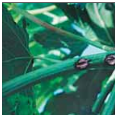
Антракноза - Sphaceloma ampelinum