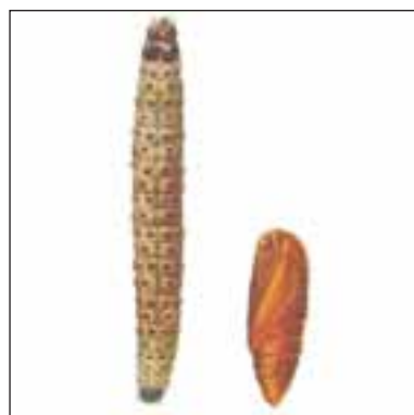
Еднопоясен гроздов молец - ларва и какавида на Eupoecilia ambiguella