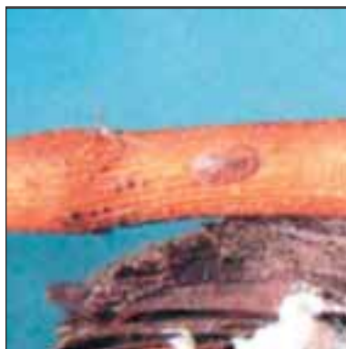
Лозова щитовка - Pulvinaria vitis