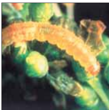
Шарен гроздов молец - Lobesia botrana