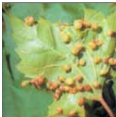
Лозова филкxера - Phylloxera vastatrix